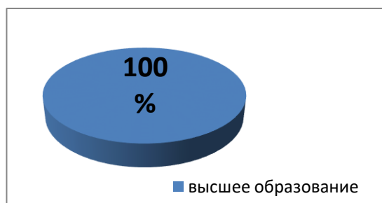
Уровень образования педагогических работников